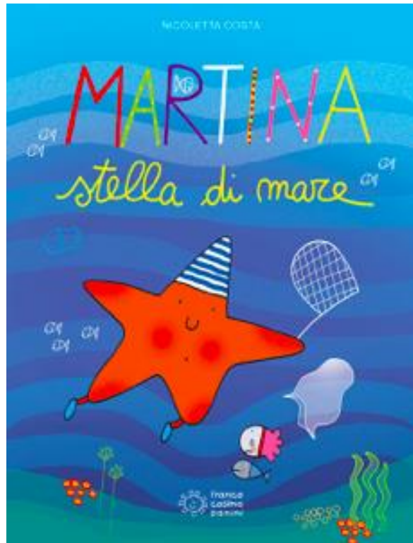
Cahier créé par Nicoletta Costa et Marevivo FVG pour expliquer l'impact de la pollution plastique à des enfants de 3 à 6 ans.