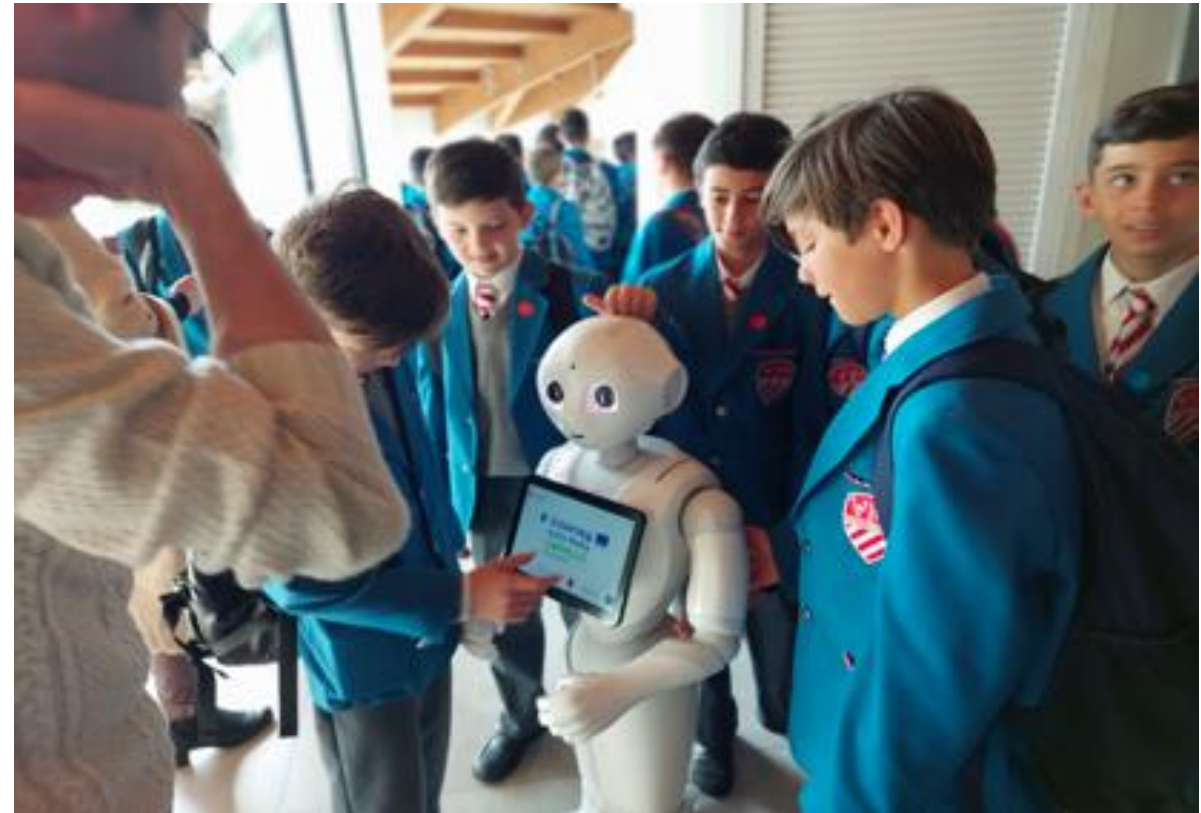
Faisant parti du projet CORALLO, Pepper le Robot est un robot humanoïde qui peut interagir avec ses utilisateurs, en répondant à des questions et en fournissant des informations